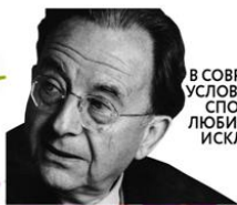
В СОВРЕМЕННЫХ УСЛОВИЯХ ЛЮДИ, СПОСОБНЫЕ ЛЮБИТЬ, СКОРЕЕ ИСКЛЮЧЕНИЕ